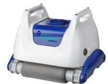
Robot Robot RKA80