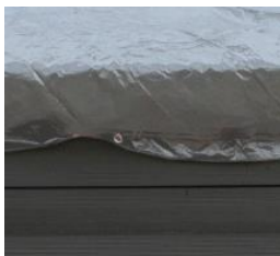
Cubierta de invierno Winter cover CIKPCO41