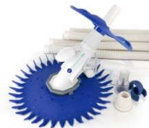
Limpiafondos automático Automatic cleaner 19007