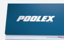
Manual de instalación y uso multilingüe