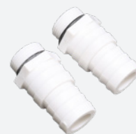
Conectores de PVC Ø 32-38 mm